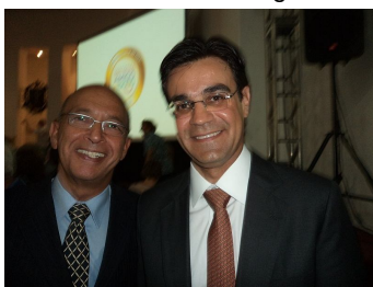
Figura 2. Alexandre Kalache e o Secretário Rodrigo Garcia da Secretaria de Desenvolvimento Social de São Paulo, na solenidade de Lançamento do Selo Amigo do Idoso, dia 28 de novembro, no Palácio dos Bandeirantes.

Ao longo de 2012, as reuniões sistemáticas e regulares do Comitê Intersecretarial avançaram na geração de uma metodologia incentivadora da adesão dos municípios ao Programa, pelo estabelecimento de metas a serem cumpridas para a obtenção da certificação do compromisso. O primeiro passo é a apresentação de um projeto emblemático do município na área do envelhecimento. A partir de então, é assinado um protocolo de intenções, emitido um Selo de Adesão, são realizadas as ações inscritas no Protocolo e apresentados os indicadores de acompanhamento. O alcance das metas implica o recebimento do Selo Amigo do Idoso – Selos Intermediários e Selo Pleno. O lançamento do Selo de Adesão de municípios a essa proposição estadual foi efetuado no dia 28 de novembro, no Palácio dos Bandeirantes, em solenidade que contou com a presença do Governador Geraldo Alckmin, de Alexandre Kalache, Secretários Estaduais, Parlamentares, Prefeitos, setores da sociedade civil e de beneficiários do Programa, além de interessados em geral.